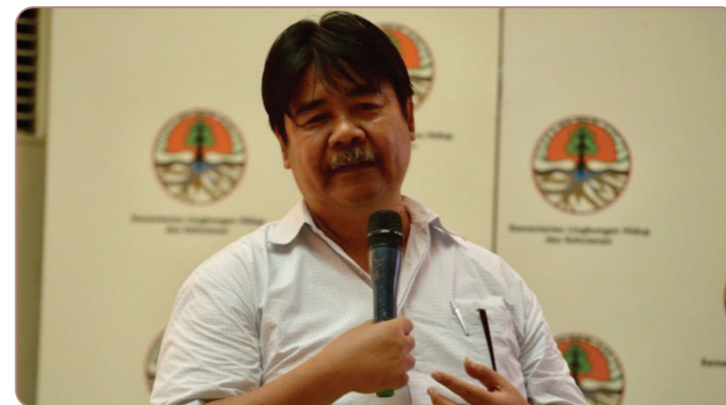
Gambar 8. Bambang Hero, Profesor Guru Besar Kehutanan di Institut Pertanian Bogor yang dikenal sebagai aktivis dan ahli forensik lingkungan, menghadapi dua serangan pada tahun 2025, yaitu kriminalisasi dan gugatan perdata.

Pada 8 Oktober 2025, Pengadilan Negeri Cibinong kemudian mengeluarkan putusan sela yang menyatakan gugatan tersebut sebagai Strategic Lawsuit Against Public Participation (SLAPP), merujuk pada Pasal 48 ayat (3) huruf c Perma No. 1 Tahun 2023 serta Putusan Mahkamah Konstitusi No. 119/PUU-XXIII/2025.