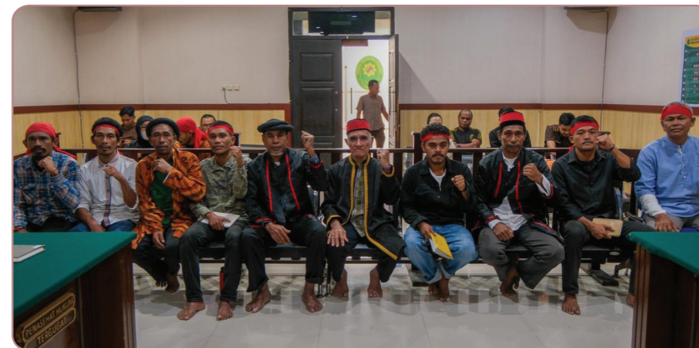
Gambar 7. Sidang Putusan 11 masyarakat adat Maba Sangaji di Pengadilan Negeri Soasio, Kota Tidore Kepulauan, 16 Oktober 2025.