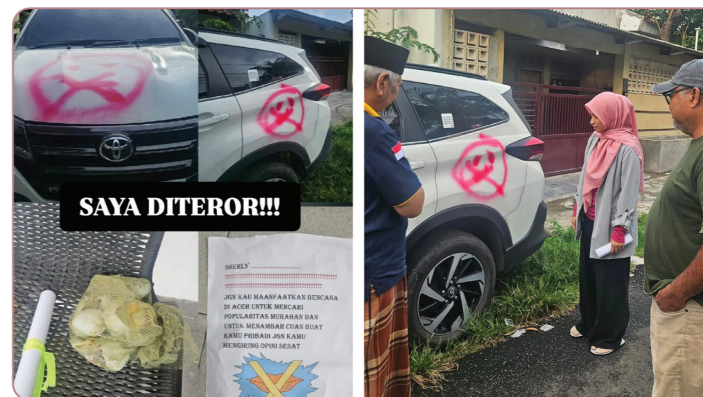
Gambar 6. Kiriman telur busuk, surat ancaman, dan vandalisme mobil Sherly Annavita.