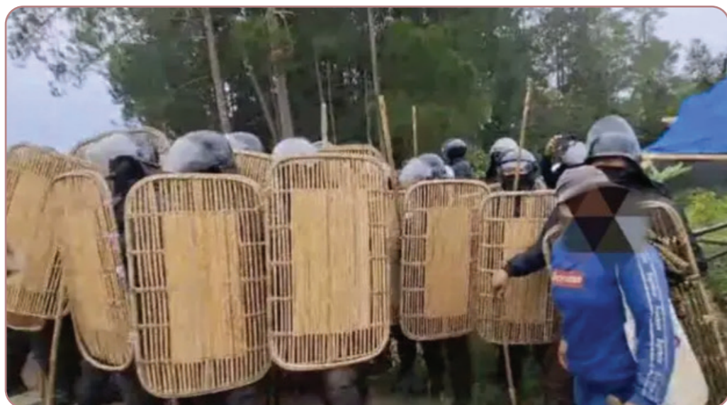
Gambar 9. Unit Keamanan PT TPL menyerang masyarakat adat Sihaporas

Sejumlah kasus menunjukkan kompleksitas tersebut. Di Rampi, penyerobotan lahan masyarakat adat melibatkan puluhan oknum aparat desa yang juga melakukan penambangan ilegal dan kekerasan. Konflik horizontal antar-warga juga terjadi, seperti dalam kasus Vincen Kwipalo dari Suku Yei yang mengalami perusakan rumah dan kendaraan. Selain itu, unit keamanan perusahaan kerap menjadi instrumen tekanan terhadap masyarakat adat, seperti yang terjadi berulang kali dalam konflik dengan PT Toba Pulp Lestari di wilayah Hutan Natinggir dan Sihaporas. Dalam banyak kasus, status pelaku kerap tidak jelas, sehingga menyulitkan upaya akuntabilitas.