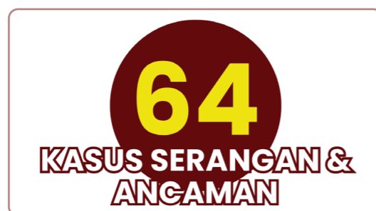
Tabel 1: Jumlah kasus serangan & ancaman berdasarkan Bulan kejadian