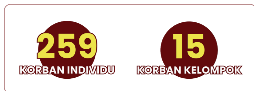
Tabel 3: Identitas korban berbasis individu/perorangan

Masyarakat adat baik secara individu dan komunitas tercatat mengalami ancaman dan serangan yang paling tinggi sebagaimana gambar di bawah. Hal ini menunjukkan bahwa perlindungan terhadap pembela HAM lingkungan sektor masyarakat adat yang berada di pelosok-pelosok pedesaan kurang optimal. Temuan dalam laporan ini, komunitas adat Natinggir dan Sihaporas berada di daerah yang cukup terpencil dan berhadapan dengan perusahaan besar, yaitu PT. Toba Pulp Lestari.