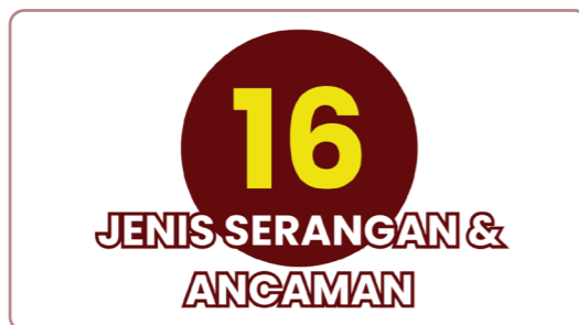
Tabel 6: Jenis Tindakan Serangan/Ancaman terhadap Pembela HAM Lingkungan Hidup