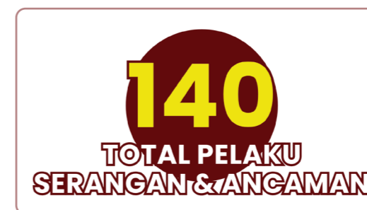
Tabel 7: Aktor pelaku serangan dan ancaman terhadap Pembela HAM Lingkungan Hidup